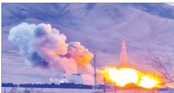
इजराइल ने ईरान के खोबाङ हेवी वाटर न्यूक्लियर कॉम्प्लेक्स पर शुक्रवार रात हमला किया।